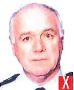
effetto occhi rossi