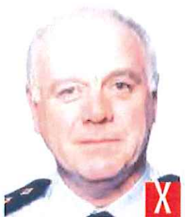
riflesso del flash sulla pelle