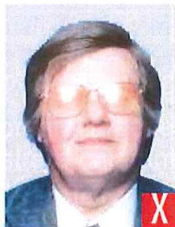
riflesso del flash sulle lenti