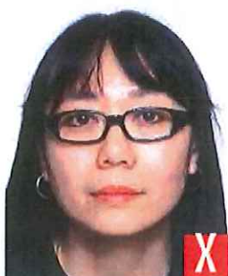
montatura troppo pesante