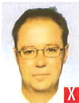
tonalità innaturale della pelle