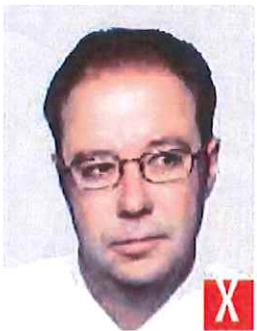
sguardo rivolto di lato