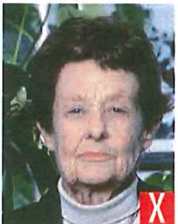
sfondo non a tinta unita