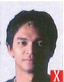
ombre sul viso