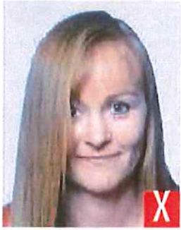
capelli sugli occhi