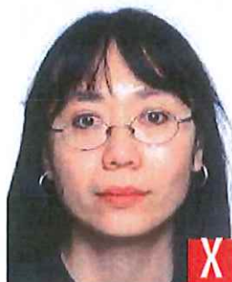
montatura che copre gli occhi