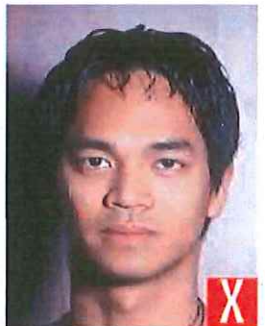
ombra dietro la testa