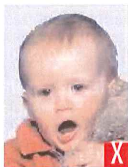
bocca aperta e giocattolo troppo vicino al viso